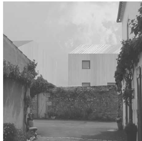
Concours d'architecture, CAUE vendée 2ème prix 2014 - Noirmoutier