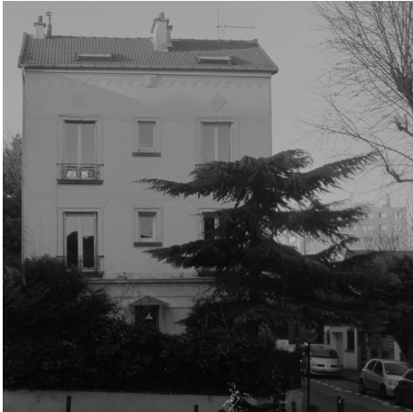
Rénovation d'un appartement