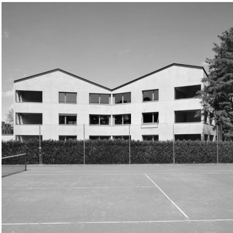
Construction d'un immeuble de 6 logements collaborateur chez Lacroix Chessex 2014 - Genève Suisse

Selectionné par magazine A vivre 2016 - La Roche sur yon