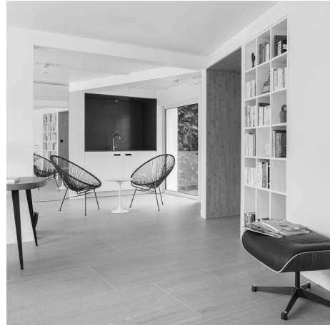
Rénovation d'une maison de 100m2

Selectionné par magazine A vivre 2016 - La Roche sur yon