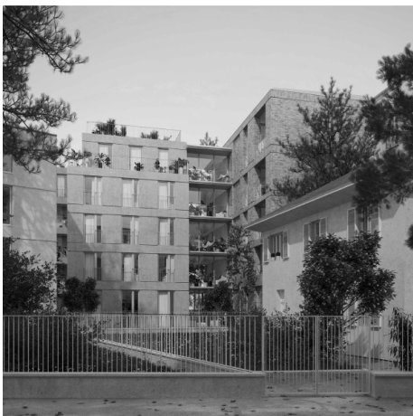
Construction d'un immeuble de 45 logements collaborateur chez Lambert Lenack 2017 - Paris